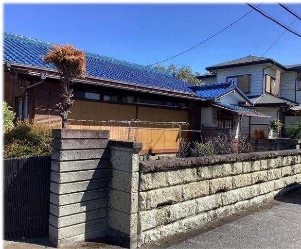
南側より撮影現地土地 掲載写真: 2023年10月撮影 ※街並み含む