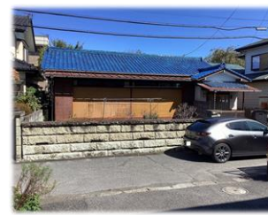
前面道路含む現地土地 (南側より撮影)