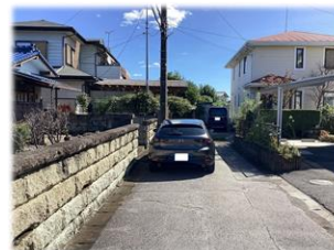
前面道路(西側より撮影)